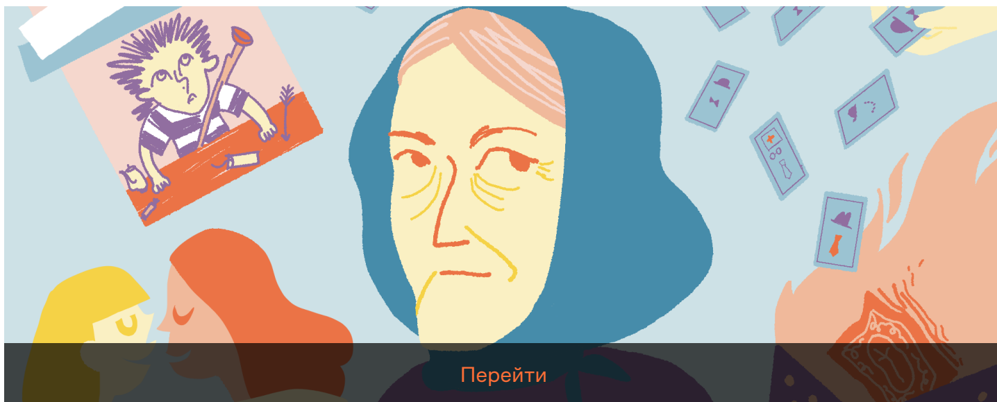
Иллюстрация: Маша Черток для ОВД-Инфо